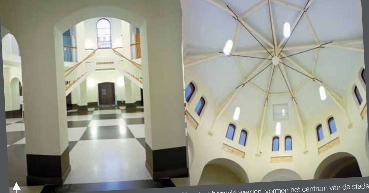
Het panopticum en de koepel, die in hun oorspronkelijke staat hersteld werden, vormen het centrum van de stads-campus. De kathedraalachtige uitstraling geeft het centrale gedeelte waardigheid.

In de Oude Gevangenis werden twee prachtige nieuwe auditoria ondergebracht: in de rode zaal kunnen xxx studenten hoorcolleges bijwonen. De blauwe zaal biedt plaats aan xxx studenten. Door de open architectuur, de moderne inrichting en de hoogwaardige akoestische afwerking zijn deze auditoria zeer gegeerd voor colloquia en congressen.