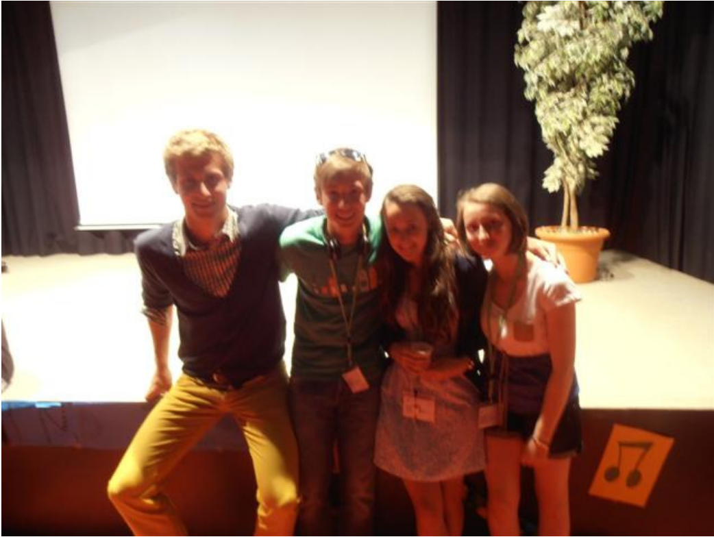
Les 4 Belges au Ceran